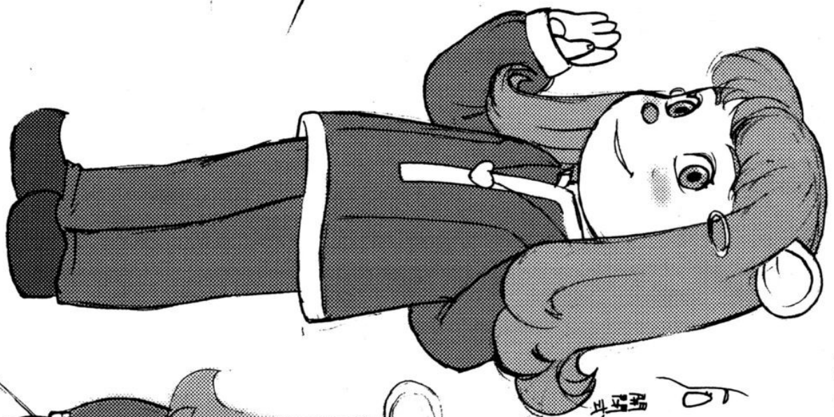
注. Trump Pa Lil Lika 入てます。かない。