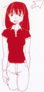
水谷 静(20) 地味な女子大生 いつも暇してる 彼氏いない歴=年齢 おっとりしてて妹思いの 優しい性格だがリア充の妹と自分を つい比較してしまいつらくなる 男を見る目はカス以下なので 優のことを一途な人間と勘違いする 混乱すると黙ってしまうタイプ

あらすじ：水谷静は妹の円に頼まれ着ぐるみスタッフの短期バイト(最終日)に妹の変装をして向かう。そこで出会った同期の男、武田優に告白をされる。優に少し惹かれていた(主に顔で)静は、自分の境遇を恨みながら告白を断るが、「一発だけやらせて」と土下座をする優を見てうっかり体を許してしまう。セックス後に自分の正体をバラす静であったが、優的には女なら誰でも良いので二人は付き合うことになった。めでたしめでたし